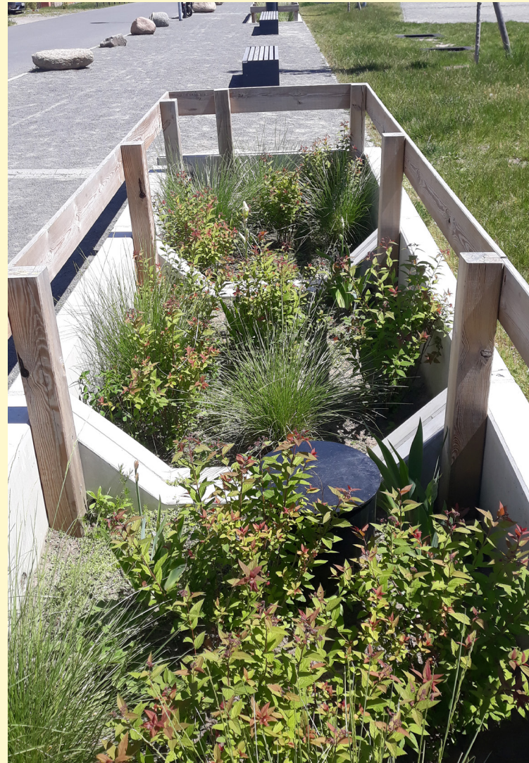
Alle Abbildungen © C. Kotremba

Anmeldefrist: Freitag, den 18.02.2022 (begrenzte Teilnehmerzahl)